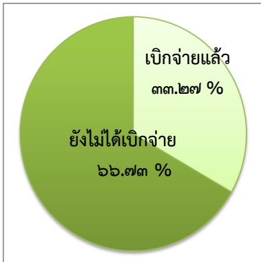
แผนภูมิที่ ๒ : แสดงการเบิกจ่าย งบประมาณของจังหวัด

◆ ยังไม่ได้เบิกจ่ายงบประมาณจำนวน ๑๗,๕๓๑,๔๐๕,๒๕๑ บาท (หนึ่งหมื่นเจ็ดพันห้าร้อยสามสิบบเอ็ดล้านสี่แสนห้าพันสองร้อยห้าสิบบเอ็ดบาทถ้วน) คิดเป็นร้อยละ ๗๑.๑๘