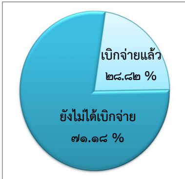
แผนภูมิที่ ๑ : แสดงการเบิกจ่าย งบประมาณทั้งหมด

พระราชบัญญัติงบประมาณรายจ่ายประจำปีงบประมาณ พ.ศ. ๒๕๕๙ บังคับใช้ ณ วันที่ ๑ ตุลาคม ๒๕๕๘ ได้จัดสรรงบประมาณตามแผนปฏิบัติการประจำปีของจังหวัด และกลุ่มจังหวัด ซึ่งเป็นไปตามกรอบแผนพัฒนาจังหวัด และกลุ่มจังหวัด ดังนี้ได้รับจัดสรรงบประมาณทั้งหมด จำนวน ๒๔,๖๒๙,๙๕๔,๒๐๐ บาท (สองหมื่นสี่พันหกกร้อยยี่สิบเก้าล้านเก้าแสนห้าหมื่นสี่พันสองร้อยบาทถ้วน) ณ วันที่ ๓๐ เมษายน ๒๕๕๙